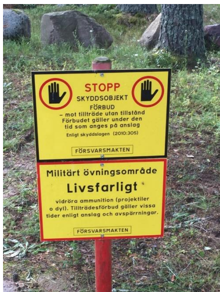
Amf1 skjutfält och övningsområden